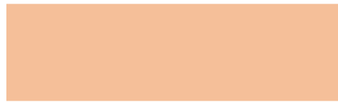
212 Mambo salmón Mambo salmão