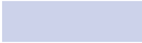
216 Charleston lila Charleston lilás