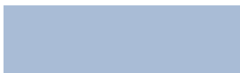
220 Tango azul Tango azul

› Las tonalidades de esta carta son orientativas.