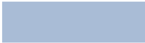
218 Vals azul Vals azul