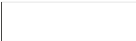
200 Merengue blanco Merengue branco