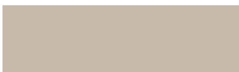
206 Swing beige Swing bege