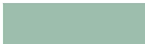
222 Samba verde Samba verde