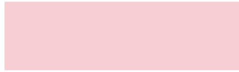
208 Bolero rosa Bolero rosa